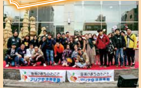
「2019アジア交流音楽祭」ベトナム人留学生や地域ボランティアの皆さんと