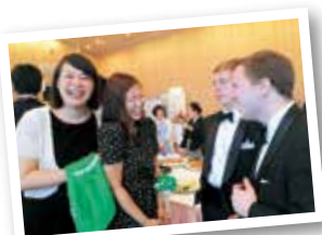
コンサート後の交流会

毎年メンバーは、当センターでの公演の前に、センター内にある「茶室・木月庵」で、「抹茶体験」をします。頑張って正座をしたり、抹茶を飲んだり点てたり…日本各地で公演するメンバーにとって“Kawasaki”は、抹茶(=日本文化)と直結した場所として定着しているそうです。