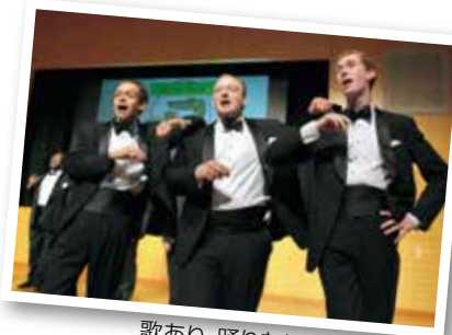
歌あり、踊りありのコンサート