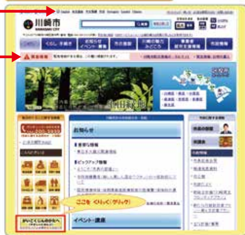
かわさきしほむべえじ (ホームページ)

▶にげるところ 病院 災害のときのための 水が あるところが わかります。(Emergency shelters, Emergency medical institutions, water supply bases etc.)