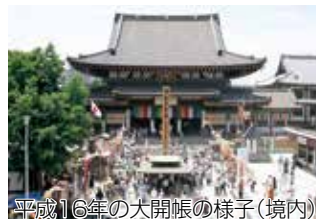
平成16年の大開帳の様子(境内)

川崎区(かわさき)にある(ある)有名な(有名な)お寺(お寺)「川崎大師(かわさきだいし) 平間寺(へいけんじ)」は1128年(ねん)に建て(た)られました。厄除(やくよ)け(怪我(けが)・病気(びょうき)・地震(じしん)・台風(たいふう)がない(ない)ようにお祈(いの)りして(もら)うこと(こと)。