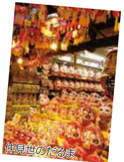
仲見世(なかつ見)のだるま

川崎大師(かわさきだいし)のまわり(まわり)には「久寿餅(くすもち)」や「とんとこ飴(あめ)」や「だるま(だるま)」のお店(みせ)が(が)あり(あ)ります。川崎(かわさき)の有名な(有名な)食べ物(たべもの)・品物(しなもの)(local specialties)が(が)あり(あ)ります。