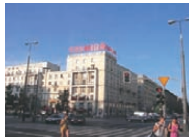
▲ワルシャワ中心部のビルに「東芝」の看板

ポーランドにある、日本企業の工場をいくつか見学しましたが、どの工場でも日本的な経営手法を取り入れ、それがポーランド人従業員にも受け入れられ、まさに日本とポーランドの融合が上手くいっているという印象を受けました。例えば、見学させていただいた工場はどれも整理整頓(靴の脱ぎ方、道具の片付け方等々)が行き届き、隅々まで塵ひとつなく清潔。そのため仕事を効率的に、安全に行うことができているようです。おそらく事故も少ないでしょう。