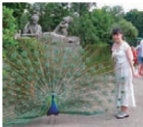
▲ワルシャワ ワジェンキ公園にて