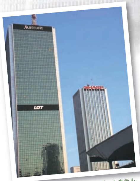
▲ワルシャワ中心部の高層のマリオットホテル。その隣のビルに「シャープ」の看板。これは高層ビルなので、かなり目立つ看板です。右下に角だけ写っているのはワルシャワ中央駅

今や海外に居住する日本人の数は100万人を超えています。この多くを占めているのは企業関係者ではないのでしょうか。海外において「日本」を象徴し、また外国人が実感できる身近な「日本」は、実は日本企業なのではないかと思えます。国際交流の最前線は、海外にある日本企業のオフィスや工場かもしれません。