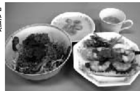
中央奥がグアイ・ブアッシー