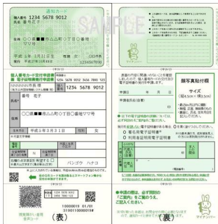
通知カードの見本

【質問】マイナンバーコールセンター（9:30～17:30 土・日曜、祝日、年末年始は 休みです） （日本語）Tel0570-20-0178 （英語・中国語・韓国語・スペイン語・ポルトガル語）Tel0570-20-0291