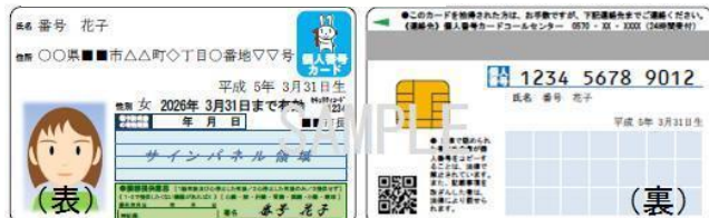
個人番号カードの見本