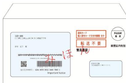
(modelo do Cartão de Notificação)