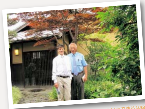
▲川崎市国際交流センターの木月庵で抹茶体験

委員会のメンバーは委員長をはじめ、皆ボランティアなので、思うようにはかどらないことも多いのが現実です。しかし、これからは若い人達とともに交流を発展させていくことが大切です、ぜひ協力したいと思います。