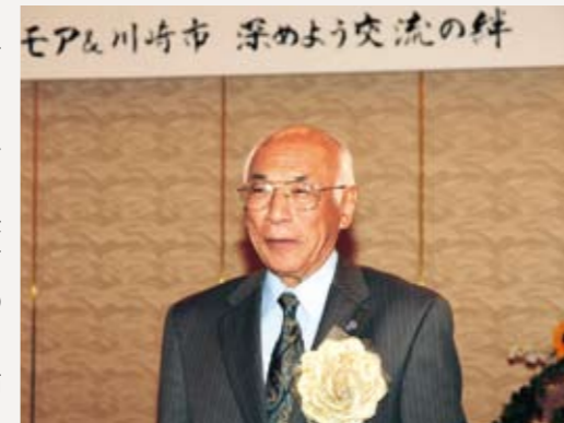
▲懐かしい人々との出会いに喜びの笑顔