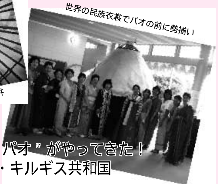
世界の民族衣裳でパオの前に勢揃い