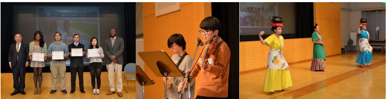
※사진은 작년의 모습입니다.